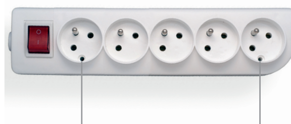
otwory do montażu